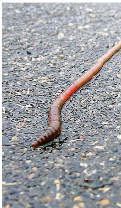
Cala la plievgia e la veia da catram seia, davainta ella ena trapla mortala pigls verms da plievgia.

Igls verms dovran ple tgi en'oura per traversar chels 2 m dalla larghezza dalla veia. Els von er betg adegna adretgve sur veia. Igl pi bagn vogl per els schi plover e la veia è bletscha. Cun la tracziun dallas musclas sa movan els d'ena vart a l'otra. Pero angal plang. Vign la veia sitga è chegl pi fadigiou. Cugl suglegl vign chegl anc mender. Els èn alloura strousch ple bungas