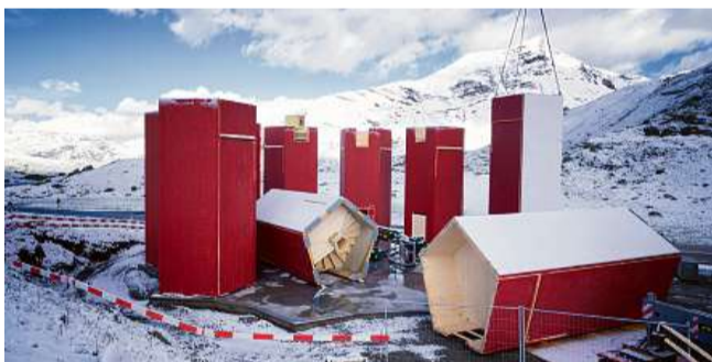
Igl onn 2017 è la tor cotschna neida erigeida segl Pass digl Gelgia.

FOTOMONTASCHA NOVA FUNDAZIUN ORIGEN/BOWIE VERSCHUUREN