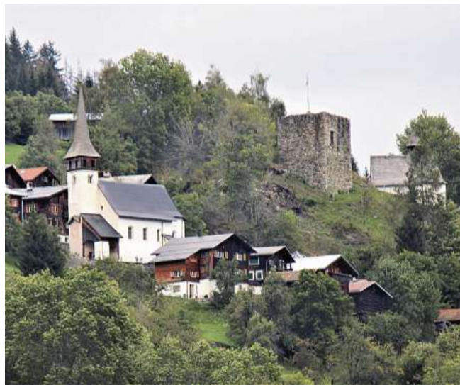
Schlans e sia tuor da Sais construïda entuorn 1200.