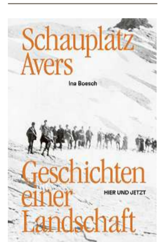
Ina Boesch «Schauplatz Avers – Geschichten einer Landschaft», Turitg, Chasa editura HIER UND JETZ, 2023, 160 paginas.

Uschia sco ch'Ina Boesch scriva dal naufragi dal resort gigantic, raquinta ella era las autras istorgias dad Avras en sia nova publicaziun – da perscrutaders d'avant 350 onns, da process cunter strias, dad emigrants ed emigrantas avant 150 onns u da la resistenza cunter ina ovra a pumpe en la Val Madris avant paucs decennis.